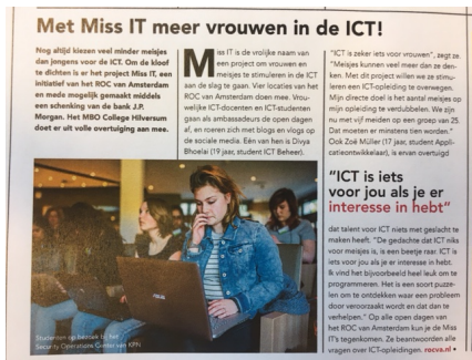
Artikel uit de Gooi en Eemborg

2017 was er een tafel met een ambassadeur. Het doel van MISS IT is meer vrouwen in de ICT te werven.